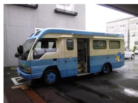
環境に優しいCNG車です。