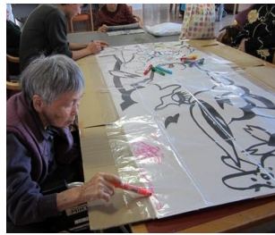
色塗り担当は任せて！