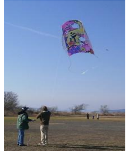
大凧がふわっと飛んだ！