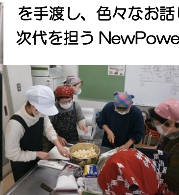
ききょうの郷 管理栄養士も そてつさんや皆さんと調理参加