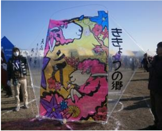
3m×3mの横骨無しスタンドグラス風大凧

1月25日 日曜日 富士川河川敷広場で富士南地区三世代交流大集会 大凧あげ大会が開催されました。ききょうの郷チームもお客様に制作いただいた大凧を初春の大空高く揚げてきました。