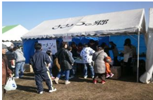
アーマビリータと一緒に100円ラーメン。