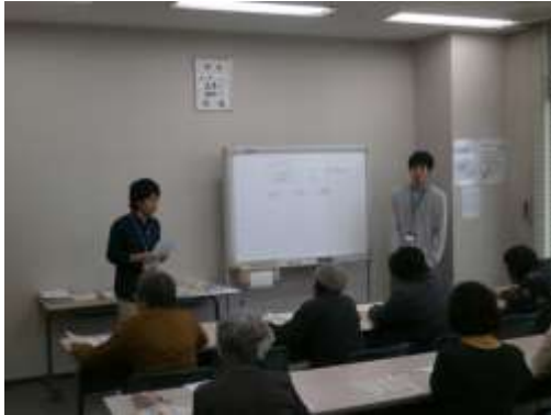
介護保険の図を手に質疑応答

3月21日 土曜日 ききょうの郷では地域向け勉強会 寺子屋“縁”（えにし）を開催、今回のテーマは2つ。第一部「介護保険の仕組みを知ろう!」では、は今春改正の介護保険と一緒に学びます。