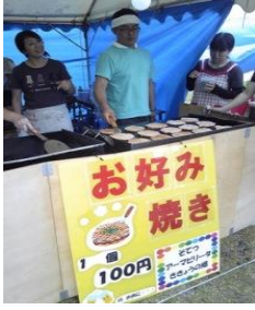
☆ 昨年のみなと祭り ☆