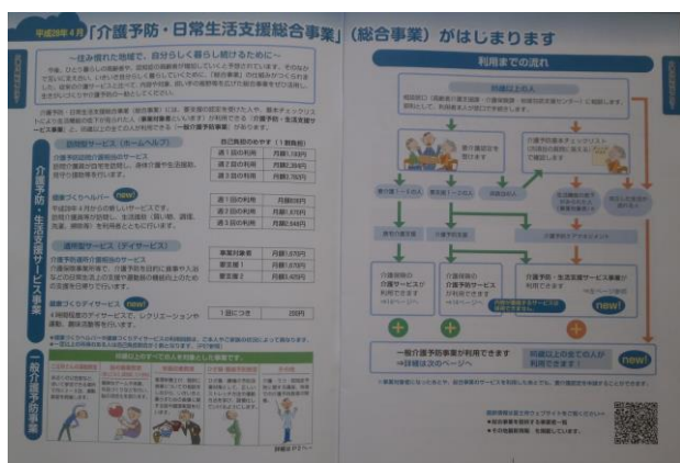
巻頭の（新）総合事業 紹介ページ